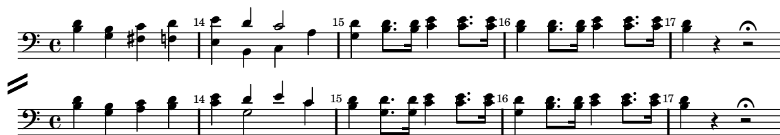
Abbildung 1: Unterschiedliche Stimmführung in den Fagotti; oben: Autograph [A], wobei die Fg2-Stimme am Chorbass orientiert ist; unten: Druck [C, D], wobei die Fg2-Stimme eher in Terzen zum Fg1 geführt ist.