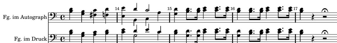
Abbildung 1: Unterschiedliche Stimmführung in den Fagotti; oben: Autograph [A], wobei die Fg2-Stimme am Chorbass orientiert ist; unten: Druck [C, D], wobei die Fg2-Stimme eher in Terzen zum Fg1 geführt ist.